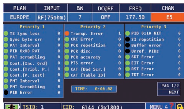
Il nuovo Rover HD TAB 9, grazie al Transport Stream Analyzer integrato, permette l'analisi del flusso dati demodulato dal tuner, o dall'ingresso ASI, e la verifica della presenza degli errori di priorità 1, 2 e 3 della norma ETR 101-290.

Come tutta la Serie HD, il TAB 9 STCOI è provvisto dell'analisi della costellazione per i segnali DVB-C/T/T2/S e S2. È possibile selezionare il REFRESH TIME (ogni quanti secondi la costellazione deve essere aggiornata) e uno START STOP delle portanti al fine di effettuare un'analisi più approfondita.