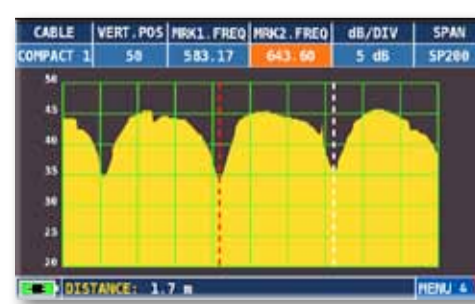
Esempio di visualizzazione Distanza del Guasto.