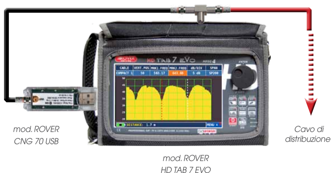
mod. ROVER CNG 70 USB